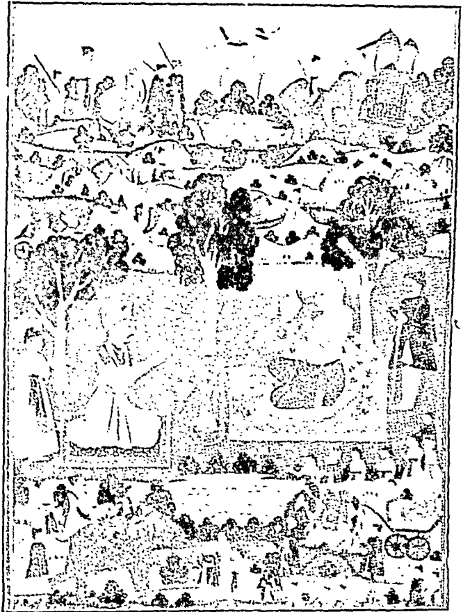
महाराजा साहू जी तथा वाजीराव पेशवा